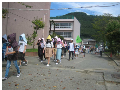
校庭への二次避難の様子