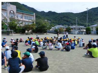
校庭で遊んでいた子供たちの避難の様子