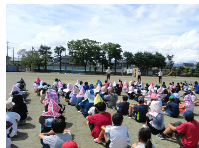
全員の避難が終了しました